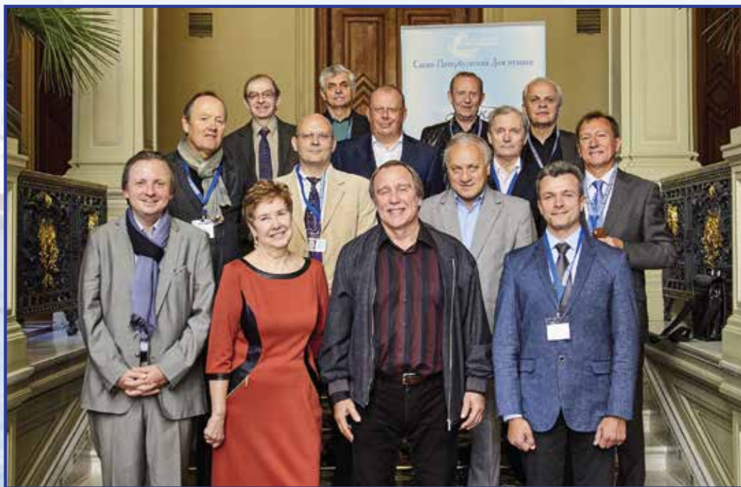
Открытие мастер-классов «Реки талантов» 5 сентября 2017 г. Педагоги.

Лучшие из лучших получают право предьявить свое искусство широкой публике концертных залов нашей страны. Каждый год мы открываем новые «звезды» нашего проекта. Уверен, что на это раз заблестят Ваши имена.