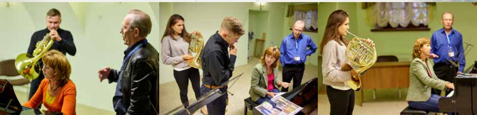
Мастер-классы «Реки талантов» 5-8 сентября 2017 г. Санкт-Петербург.

награжден медалью «За трудовую доблесть», в 2008 году – медалью ордена «За заслуги перед отечеством» II Степени за большие заслуги в развитии отечественной культуры и искусства, многолетнюю плодотворную деятельность.