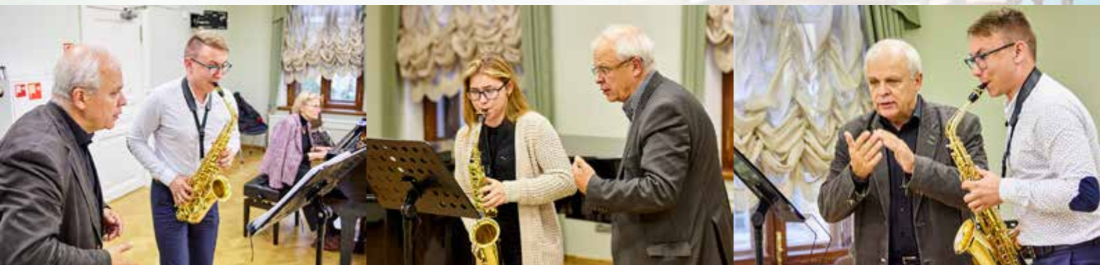
Мастер-классы «Реки талантов» 5-8 сентября 2017 г. Санкт-Петербург.

Член жюри многих международных конкурсов, дает мастер-классы в России, Германии, Японии, Финляндии и других странах.