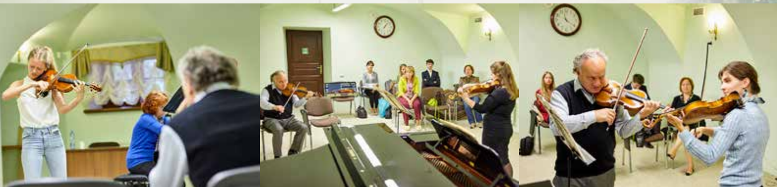
Мастер-классы «Реки талантов» 5-8 сентября 2017 г. Санкт-Петербург.