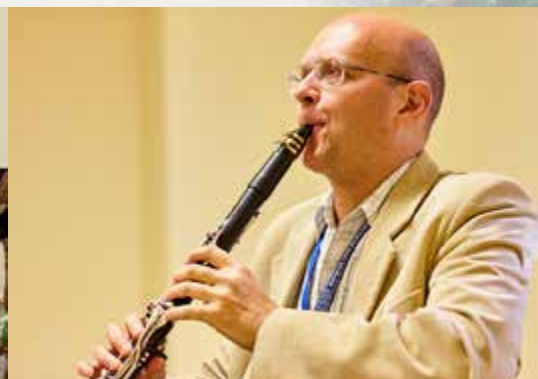
Мастер-классы «Реки талантов» 5-8 сентября 2017 г. Санкт-Петербург.