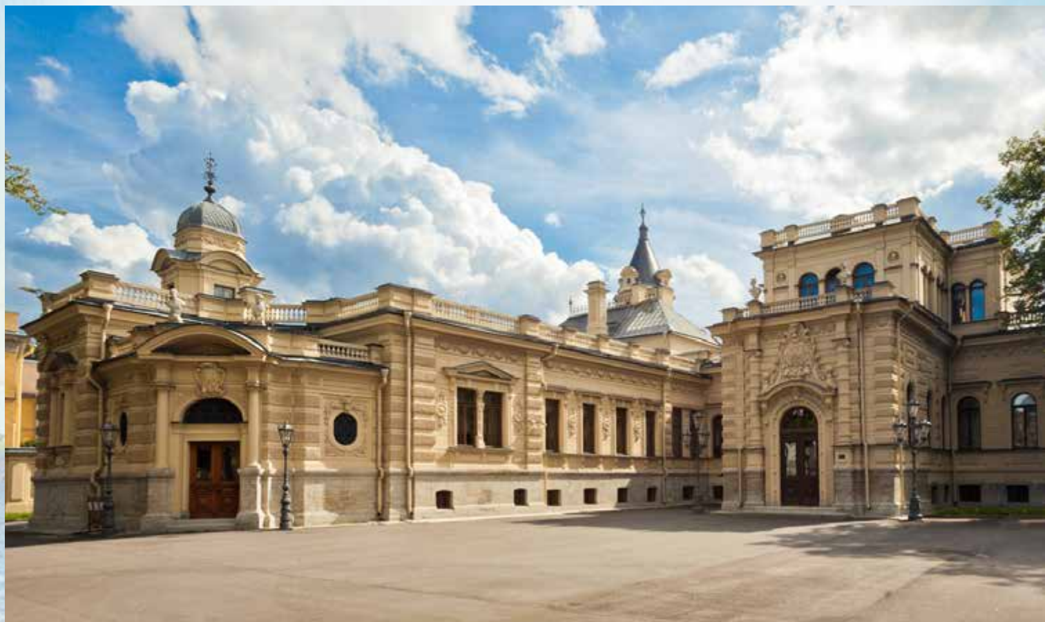
Дворец Великого князя Алексея Александровича. Санкт-Петербург, наб. реки Мойки, 122.

Все эти помещения донесли до нас вкусы последнего генерал-адмирала Российской империи.