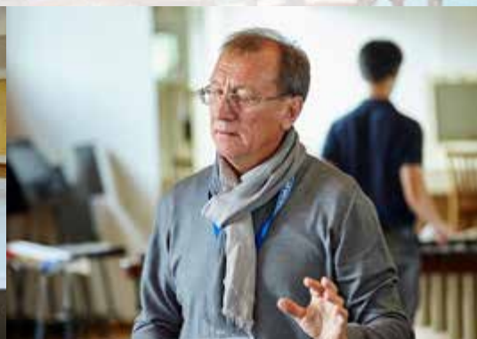
Мастер-классы «Реки талантов» 5-8 сентября 2017 г. Санкт-Петербург.