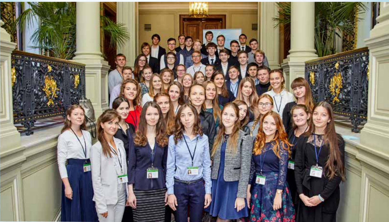
Участники торжественного открытия мастер-классов «Реки талантов» 5 сентября 2017 г. Санкт-Петербург

11 ноября (суббота) – Ярославская государственная филармония