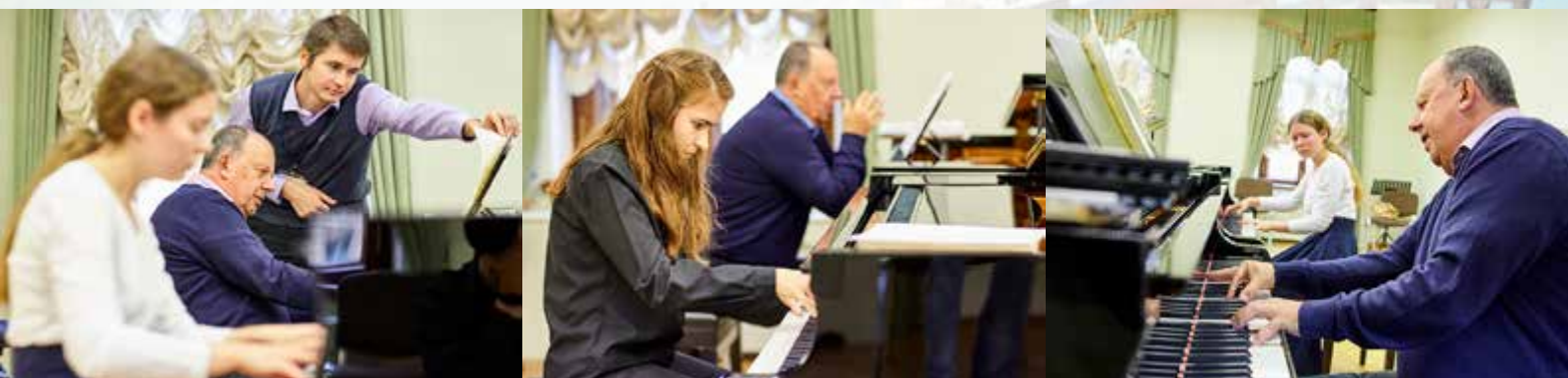
Мастер-классы «Реки талантов» 5-8 сентября 2017 г. Санкт-Петербург.