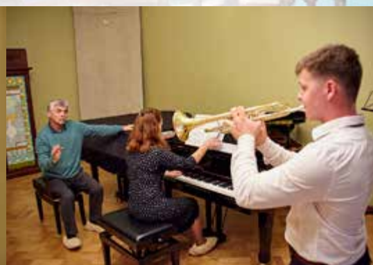
Мастер-классы «Реки талантов» 5-8 сентября 2017 г. Санкт-Петербург.