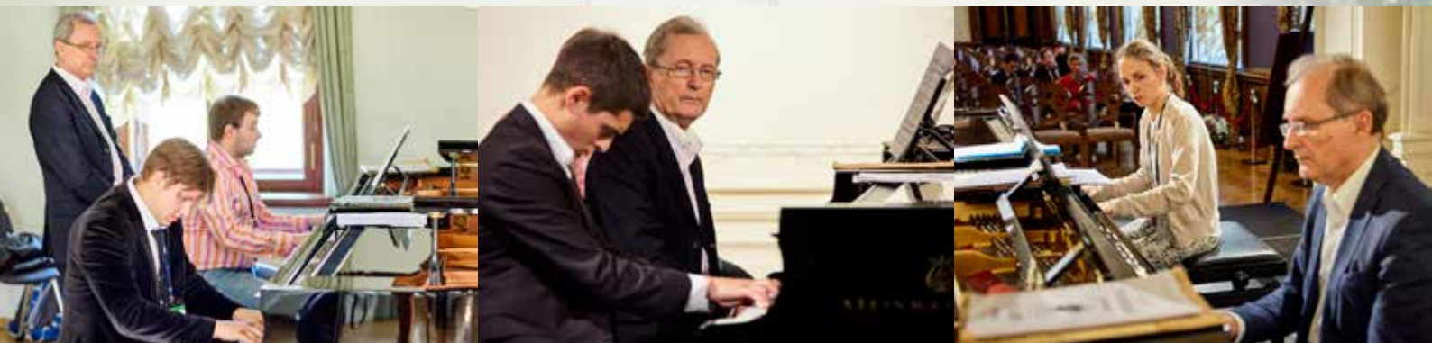
Мастер-классы «Реки талантов» 5-8 сентября 2017 г. Санкт-Петербург.