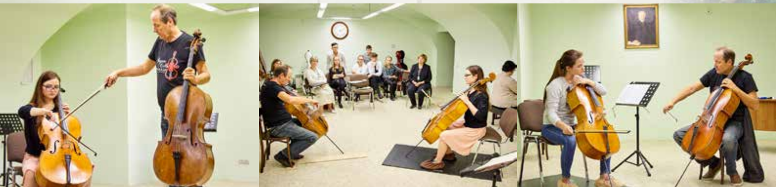
Мастер-классы «Реки талантов» 5-8 сентября 2017 г. Санкт-Петербург.

У Мартти Роуси есть сольные записи и записи с камерным оркестром звукозаписывающих компаний ONDINE и FINLANDIA. Играет на виолончели Карло Джузеппе Тесторе, изготовленной в 1698 году и Ж.-Б. Лефевра изготовленной в 1760 году.