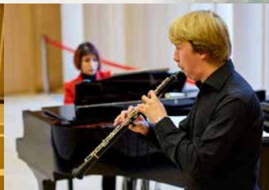
Мастер-классы «Реки талантов» 5-8 сентября 2017 г. Санкт-Петербург.