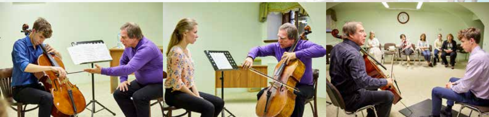
Мастер-классы «Реки талантов» 5-8 сентября 2017 г. Санкт-Петербург.

В 2011 году за большой вклад в отечественное музыкальное искусство и подготовку музыкально-педагогических кадров награждён Орденом Почёта. В 2016 году – орденом Александра Невского.