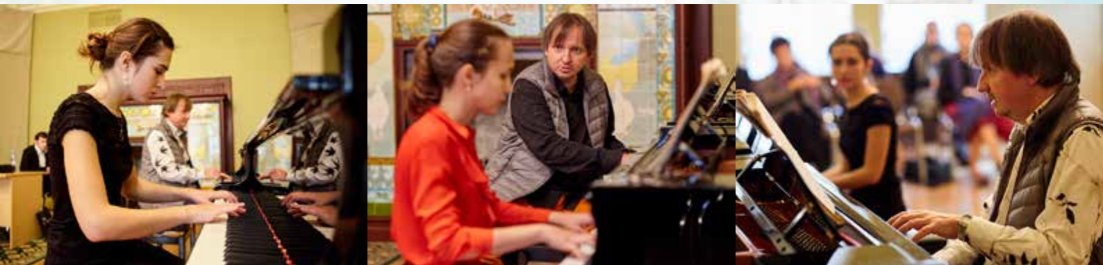
Мастер-классы «Реки талантов» 5-8 сентября 2017 г. Санкт-Петербург.